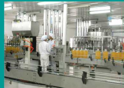
Industria de alimentos